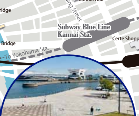
5 ZOU NO HANA PARK (Elephant's Nose Park) The park preserves the wharf built in 1859 along with the opening of the port of Yokohama. It was named after the shape of the breakwater which looks like an elephant's nose.