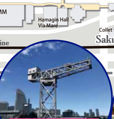
3 HAMMERHEAD CRANE The crane is a large-size cargo handling machine made in Britain more than 100 years ago. It is the symbol of Yokohama Hammerhead, a facility with a passenger ship terminal, hotel and commercial facilities.