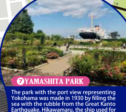
7 YAMASHITA PARK The park with the port view representing Yokohama was made in 1930 by filling the sea with the rubble from the Great Kanto Earthquake. Hikawamaru, the ship used for the Seattle line during and after the war, is preserved.