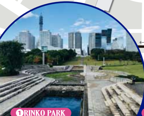
1 RINKO PARK Enjoy the great view of Port of Yokohama from the largest park in Minato Mirai 21. The spacious lawn and the curved waterfront make it an ideal spot to relax and feel the breeze.