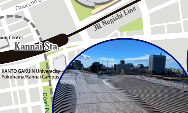
6 OSANBASHI The pier has been the gateway to the sea since the opening of the port. It has been reconstructed multiple times before the current 7th terminal. The wooden-deck rooftop with lawn spaces is a popular spot to enjoy the port view.