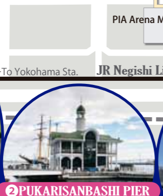
2 PUKARISANBASHI PIER It is a floating terminal for regular liners and excursion boats that cruise around Port of Yokohama. The white tower with a green roof is an icon of the port.