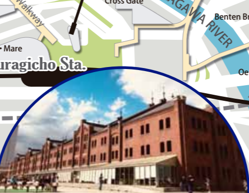
4 RED BRICK WAREHOUSE The bonded warehouse built at the beginning of the 20th century is now a commercial complex, but still has the traces of the past. It is one of the major tourist attractions in Yokohama accommodating various seasonal events.